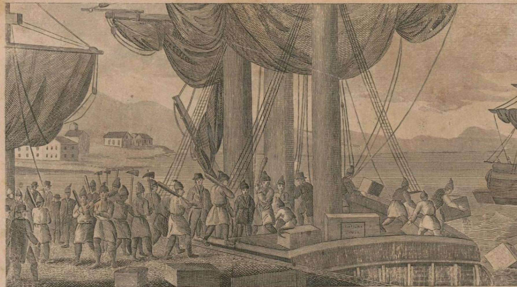
DESTRUCTION OF THE TEA IN BOSTON HARBOR